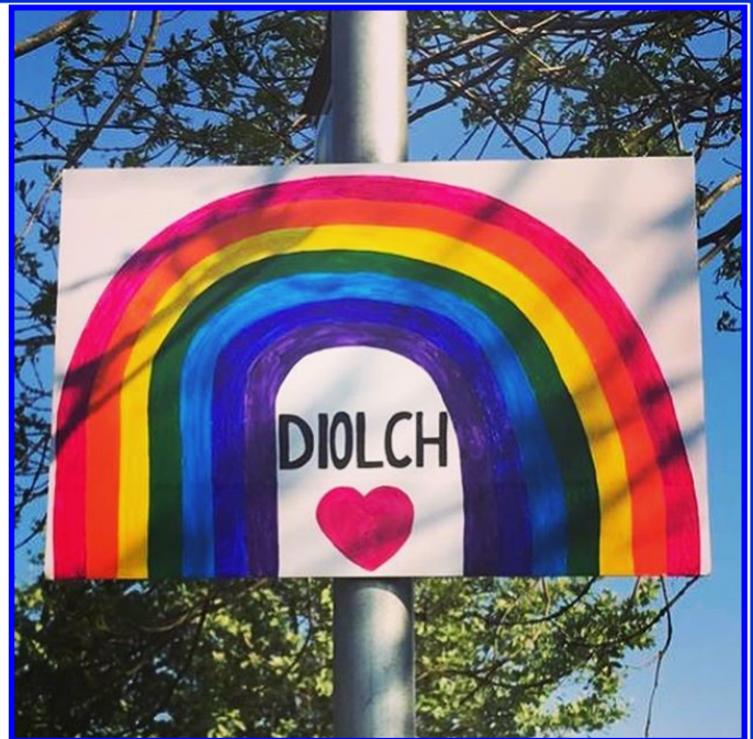
Arwydd o ddiolch yn Llangristiolus

Fel arfer, mae'n amser pan rydym ni'n dod at ein gilydd i ddathlu gyda digwyddiadau a seremonïau gwobrwyo. Er na all digwyddiadau ledled yr Ynys gael eu cynnal yn 2020 oherwydd y sefyllfa Coronafeirws, rydym yn awyddus i gydnabod ymdrech gwirfoddolwyr nid yn unig yn ystod y pandemig hwn, ond trwy gydol y flwyddyn. Rydym ni wedi gweld rhai straeon gwych am ein helusennau, mudiadau a grwpiau yn arall-gyfeirio'u gwasanaethau wrth ymateb i'r cyfyngiadau, felly gadewch i ni barhau â'r creadigrwydd hwnnw yn ystod Wythnos Gwirfoddolwyr a rhoi'r gydnabyddiaeth y mae gwirfoddolwyr yn ei haeddu. Bydd Wythnos Gwirfoddolwyr eleni yn amser i ddweud "DIOLCH".